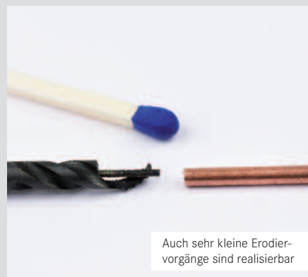
Auch sehr kleine Erodiervorgänge sind realisierbar