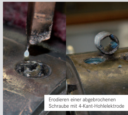
Erodieren einer abgebrochenen Schraube mit 4-Kant-Hohlelektrode