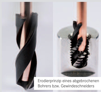
Erodierprinzip eines abgebrochenen Bohrers bzw. Gewindeschneiders