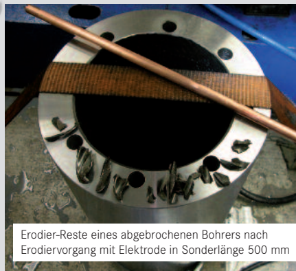
Erodier-Reste eines abgebrochenen Bohrers nach Erodiervorgang mit Elektrode in Sonderlänge 500 mm