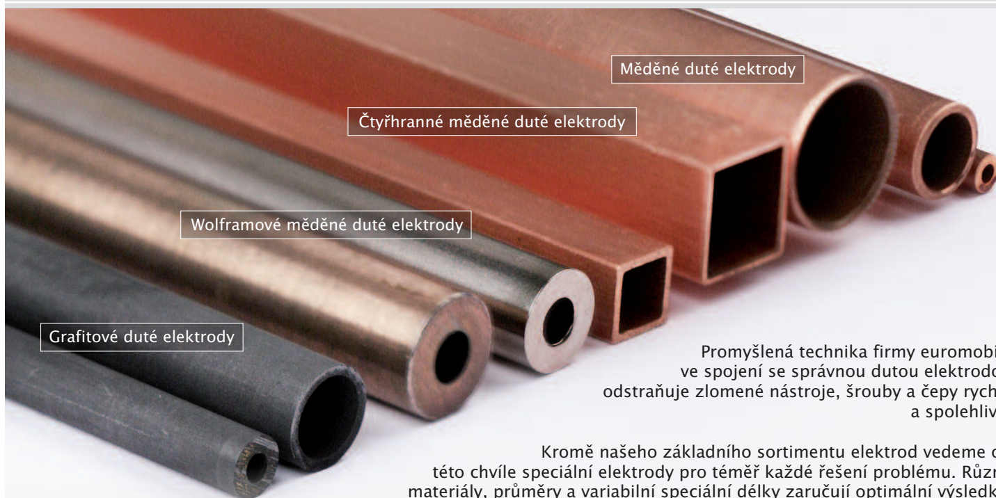
Měděné duté elektrody

Pro doposud neřešitelné problémy při erodování